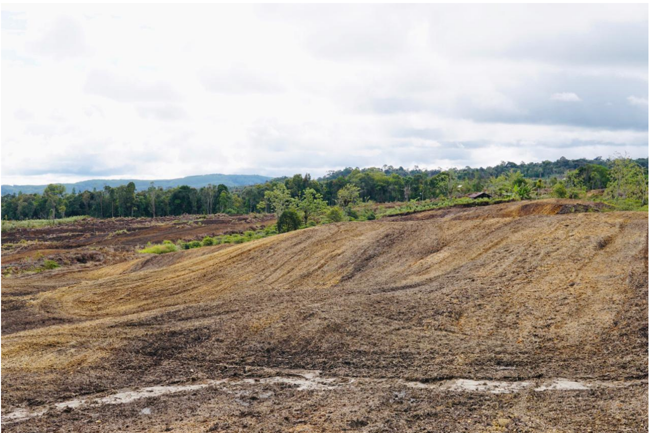
Gambar 5: Penampakan salah satu bidang lahan untuk Food Estate Sumatera Utara

Dalam laman resmi Pemerintah Kabupaten Humbang Hasundutan, kawasan Food Estate yang berada di wilayah MA Pandumaan Sipituhuta pada tahap pertama (Super Prioritas Tahun 2020) akan ditanami tanaman kentang pada lahan seluas 263 hektar. Pada tahap pertama ini, swasta yang berinvestasi untuk tanaman kentang adalah PT Calbee Wings dan PT Indofood.