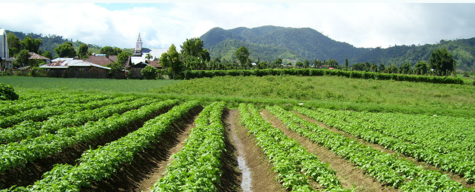
Gambar 1: Ilustrasi kebun kentang. Rencananya food estate yang berada di wilayah adat Pandumaan Sipituhuta akan dijadikan kebun kentang.

Masyarakat Adat Pandumaan Sipituhuta (MA Pandumaan Sipituhuta) adalah kelompok masyarakat yang menempati Desa Pandumaan dan Desa Sipituhuta, Kecamatan Pollung, Kabupaten Humbang Hasundutan, Sumatera Utara. Masyarakat kedua desa ini mempunyai asal-usul sejarah dan hubungan genealogis yang sama, yakni keturunan dari Marga Marbun yang berasal dari Bakkara, sejak 300 tahun yang lalu. Mata pencaharian utama mereka adalah haminjon (getah kemenyan). Bagi mereka pohon haminjon adalah pohon kehidupan, karena telah memberikan penghasilan yang baik untuk masyarakat dan juga bagian dari identitas masyarakat. Tombak haminjon (hutan kemenyan) memiliki nilai-nilai historis dan spiritualitas. Pohon ini tidak bisa dirusak atau ditebang secara sembarangan oleh masyarakat