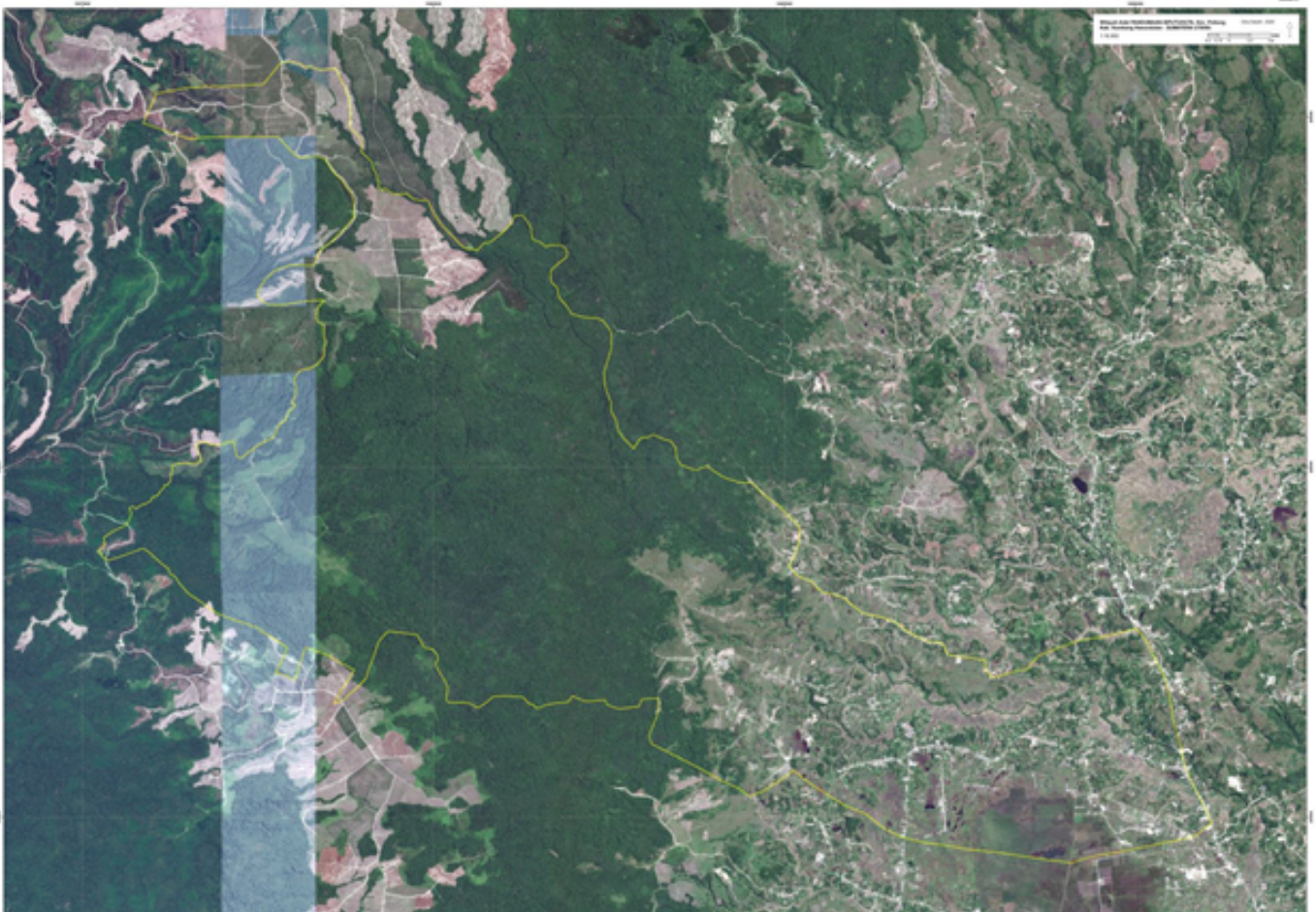
Gambar 2: Peta Deliniasi Citra Satelit Wilayah MA Pandumaan Sipituhuta

Akhir Oktober 2019, wilayah adat MA Pandumaan Sipituhuta diakui oleh Pemerintah Kabupaten Humbang Hasundutan. Hal ini disebutkan dalam Keputusan Bupati Humbang Hasundutan Nomor 201 Tahun 2019 menetapkan Wilayah Adat Masyarakat Hukum Adat Pandumaan Sipituhuta seluas 6.186,17 hektar.